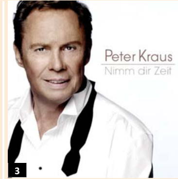
3 03/2009 61 Nimm dir Zeit