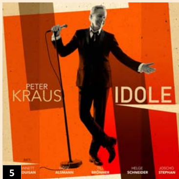
5 07/2022 87 Idole