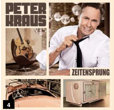
4 04/2014 26 Zeitensprung